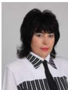
Паршина О.А. ©