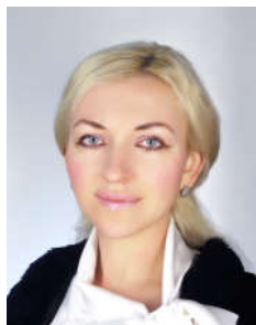
Івченко О.М. © викладач