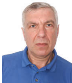
Місяць Ю.В. © викладач