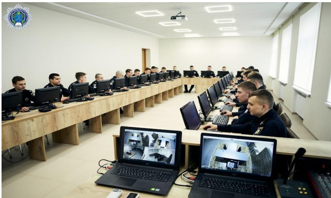
Рис. 4. Каб. 129 мультимедійна аудиторія. Використовується під час проведення практичних занять. Ведеться спостереження, що відбувається на полігоні, аналіз типових помилок під час реагування на факти вчинення домашнього насильства.