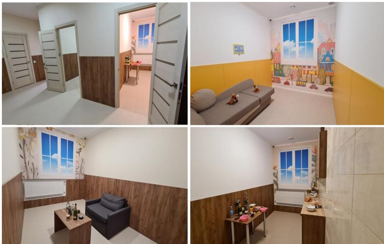
Рис. 1. Навчально-тренувальний полігон «Із запобігання та протидії домашньому насильству» на базі ДДУВС

Основним завданням полігону (аудиторії, кімната з декораціями двокімнатної квартири) є забезпечення проведення практичних занять на високому науковому, методичному і технічному рівні згідно з чинними навчальними програмами і методичними рекомендаціями, а також організація і проведення позааудиторної, факультативної, гурткової роботи, завдяки чому розвиваються творчі дослідницькі здібності здобувачів.