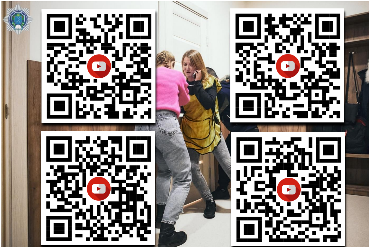
Рис 5. Приклади форм домашнього насильства: соціальні ролики.