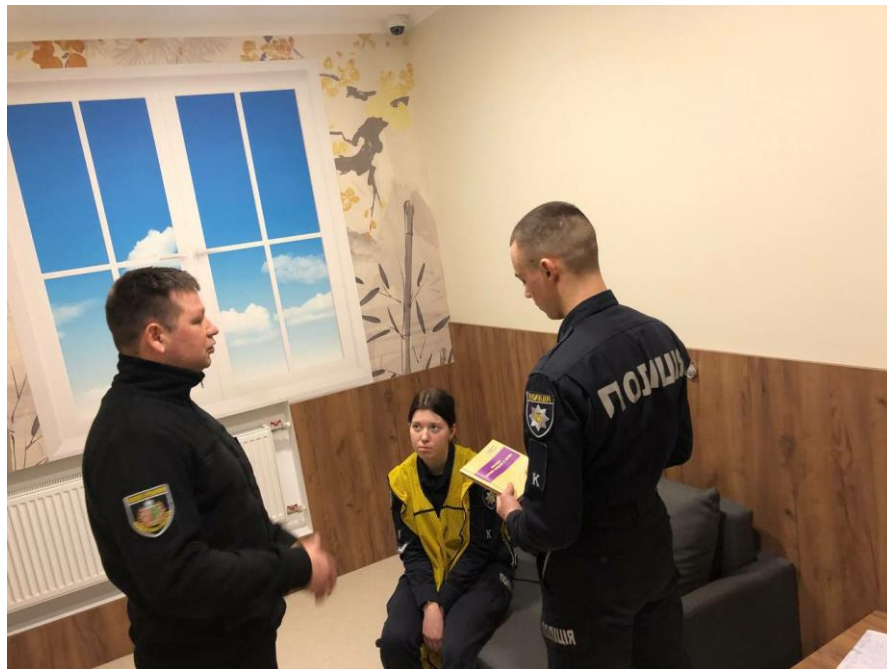
Рис. 2. Примітка: проведення практичного заняття на базі полігону «Із запобігання та протидії домашньому насильству». Алгоритм дій працівників поліції з постраждалими особами від домашнього насильства.