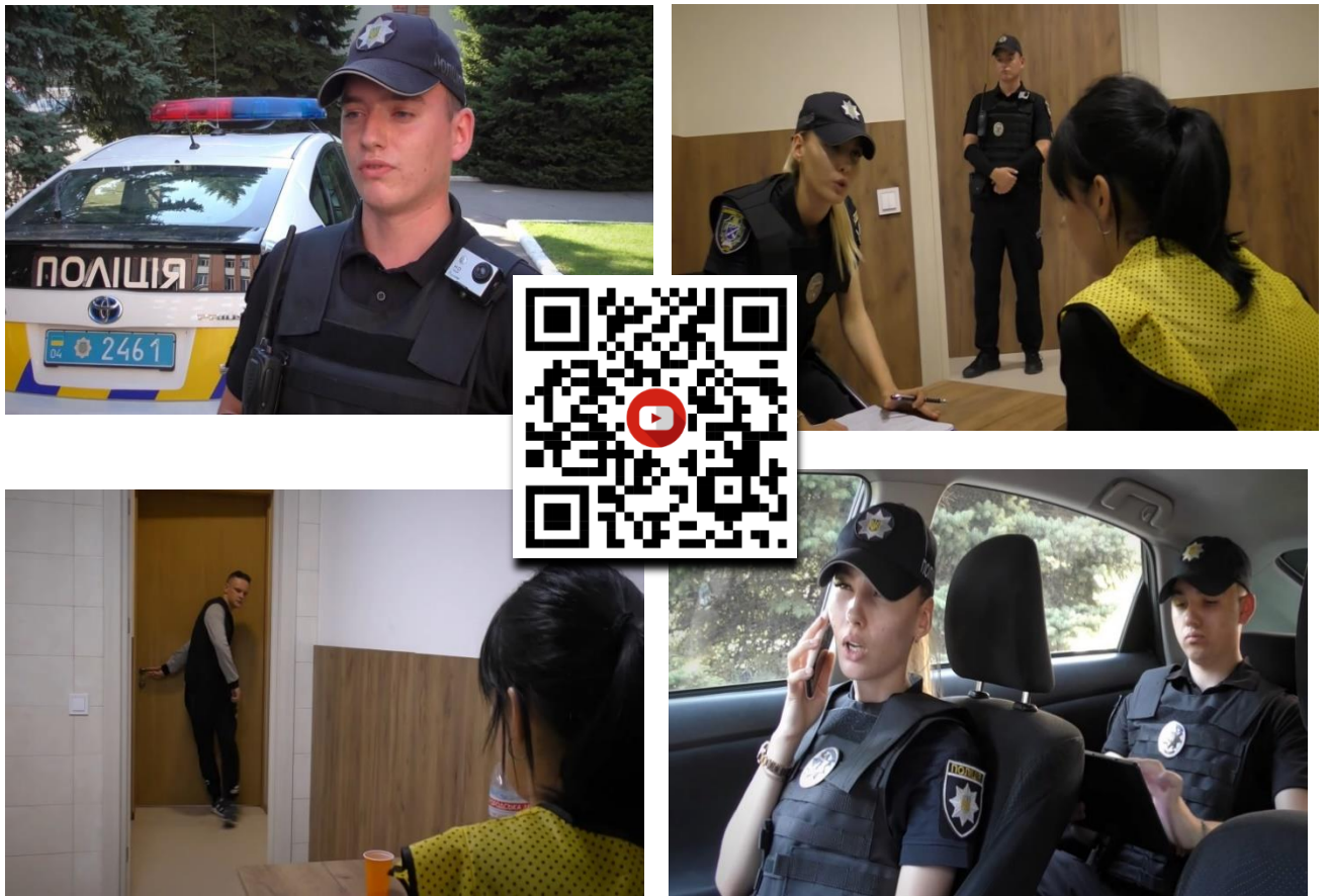
Рис. 3. Приклад проведення поліцейського квесту на навчальному полігоні «Із запобігання та протидії домашньому насильству».