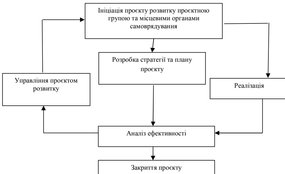
Рис. 1. Алгоритм процесу управління проектом розвитку

Процеси управління пов'язані своїми результатами – результат виконання одного стає початковою інформацією для іншого. На рис. 1 наведено алгоритм процесу управління проектом розвитку.