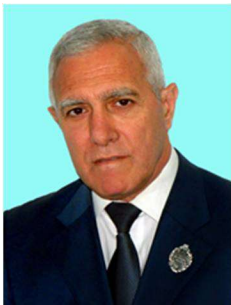
Аріф ГУЛІЄВ © доктор юридичних наук, професор, Заслужений працівник освіти України (Київський університет інтелектуальної власності та права Національного університету «Одеська юридична академія», м. Київ, Україна)