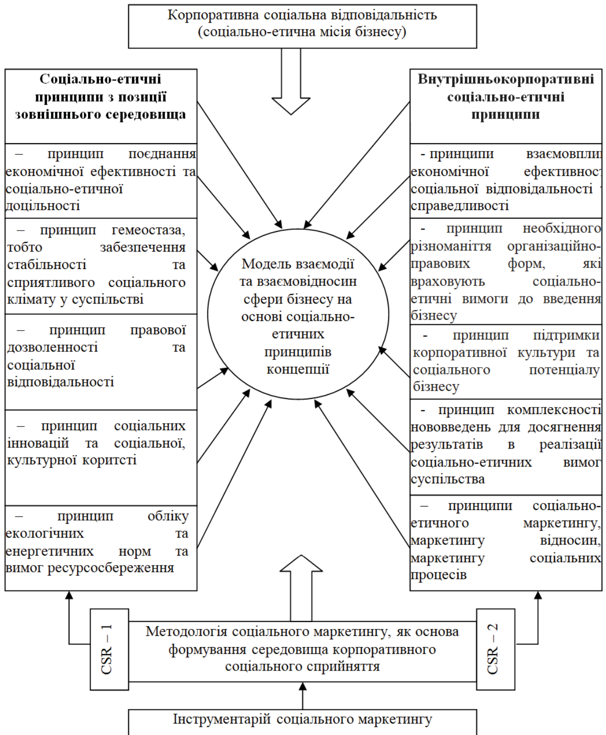
Рис. 2. Концепт-система взаємодії та взаємовідносин сфери бізнесу на основі ідеології КСВ та соціального маркетингу Складено автором за [5,8]

Розглядаючи соціально-етичні принципи, які встановлюються в бізнесі в процесі соціально-орієнтованої політики, відображаючи досягнутий попередній досвід в цілому і окремих верств суспільства.