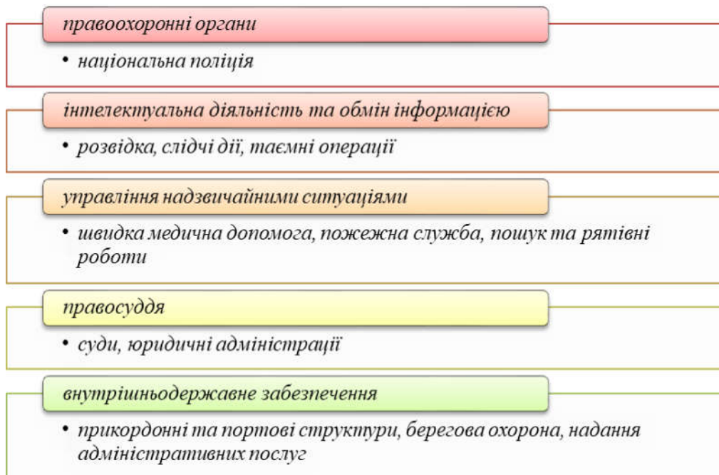
Рис. 1. Графічне зображення умов забезпечення громадської безпеки

Таким чином, громадська безпека – це стан упорядкованих суспільних правовідносин, при якому кожна особа, державний орган, органи місцевого самоврядування та їх посадові особи з власної волі дотримуються правових і морально-етичних норм, соціальних норм і правил, виконують усі рекомендації з метою досягнення громадської безпеки та благополуччя.