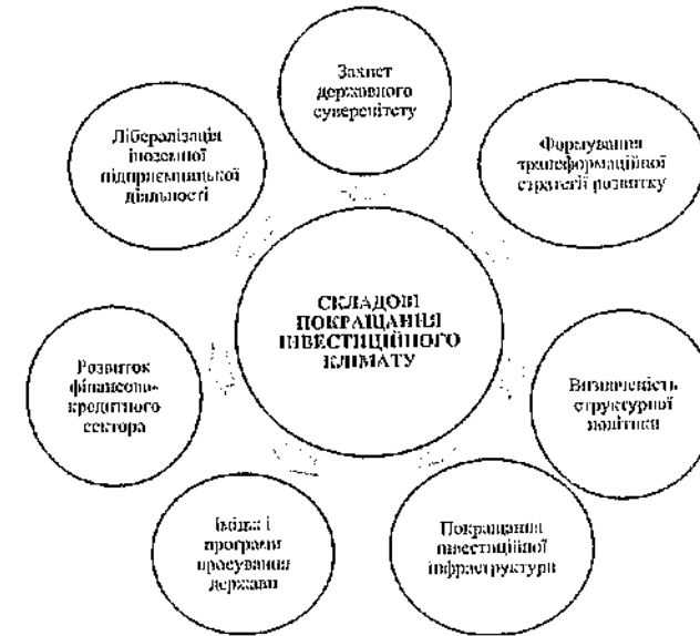
Рис. 2. Складові покращення інвестиційного клімату в Україні